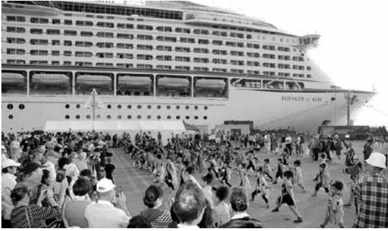
9月に入港したボイジャー・オブ・ザ・シーズ

【答】平成26年度は12回以上の寄港が予定されていることもあり、予定、状況を説明会