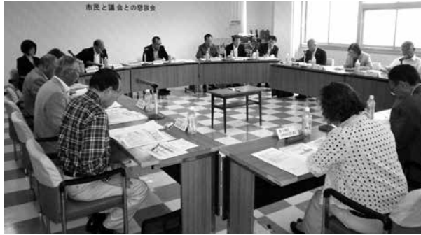
民生常任委員会での懇談会風景

各委員からは「補助金につ いては、目的と使い勝手を考 慮し、要件緩和の検討が必 要」「民生委員の多忙さにつ いては十分理解できた。皆さん の声を聞き議会として質問、 提案をするなど、議会として の役割を強めていかなければ ならない」などの意見が出さ れました。