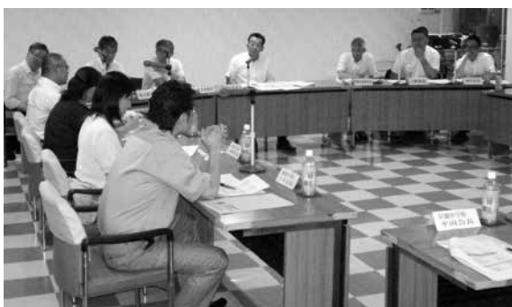
総務常任委員会での懇談会風景