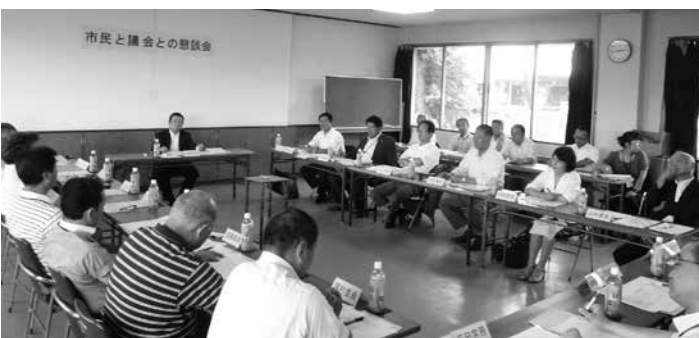
経済建設常任委員会での懇談会風景

懇談会の中では、市場の耐 震問題にも触れましたが、 今後、市、議会、関係者が積極 的に意見交換していく必要性 があるとの共通認識も図られ、 今後の議会論議へ向けても、 大変有意義な懇談会となりま した。