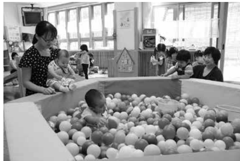
親子が集う子育てふれあいセンター

【答】 両施設とも当面は現状を維持する。保育士の採用については、職員全体の今後の採用を協議する中で検討する。