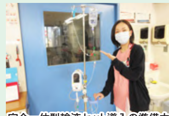
完全一体型輸液セット導入の準備中