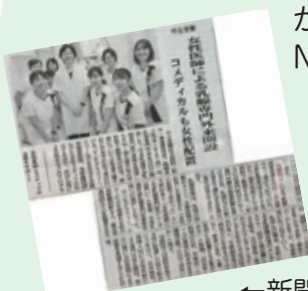
北海道医療新聞社

診療開始にあたりNHKでTV取材の様子 が放送されました。放送内容は「北海道 NEWS WEB」サイトでご覧いただけます