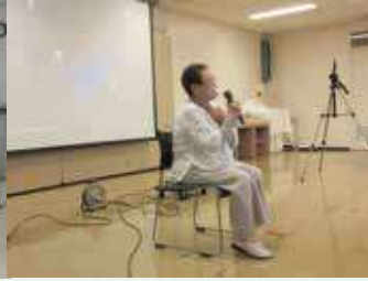
患者さん体験談の様子