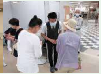
講演後挨拶の様子