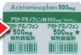
医薬品に付いているバーコードです