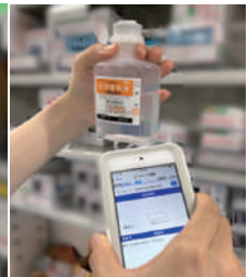
医薬品のバーコードを読み取り機で照合します