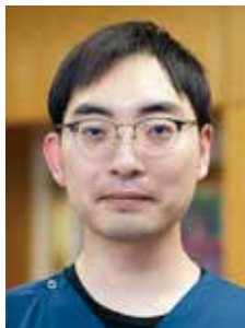
精神保健指定医 精神科科長

当院は2022年12月15日にCPMS登録医療機関となり、院内での診療体制を整え、今年度よりクロザリルによる治療を行うことができるようになりました。統合失調症の方で、これまでの治療で十分に症状が改善しない、または副作用のために十分に薬が服用できない場合には、クロザリルの使用が有効な可能性がありますため、ぜひ当科にご相談ください。