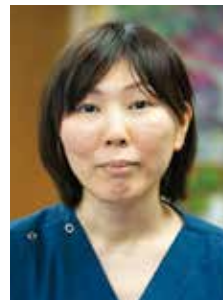
精神保健指定医 精神科医長