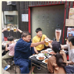
室蘭浜町商店街振興組合