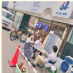
シャンシャン共和国