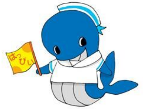
はっぴい室蘭21 マスコットキャラクター はびらん

これまでの取り組みから課題を整理し、今後12年間に取り組むべき目標を定めた新たな計画を策定しました。