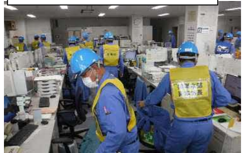
JESCO当初職員 避難状況