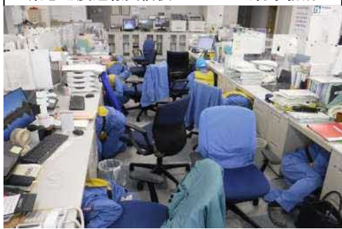
緊急地震速報受信後のJESCO当初事務所