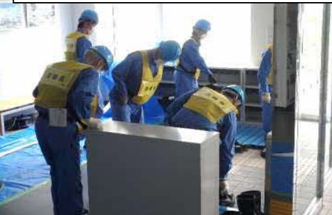
JESCO増設職員 避難状況