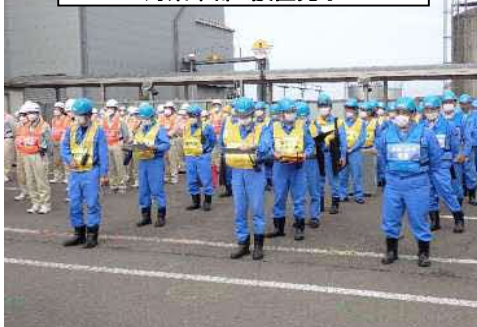
対策本部 設置完了