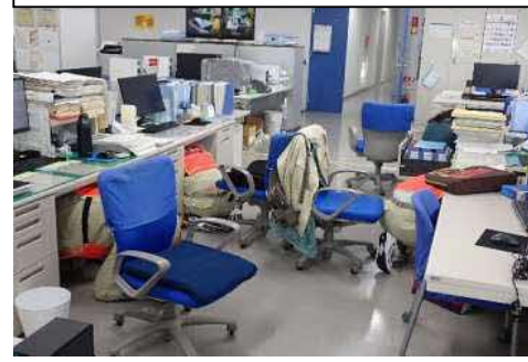
緊急地震速報受信後のMEPS増設事務所