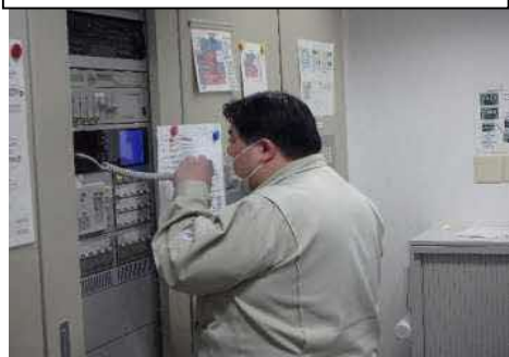
当初中制：緊急地震速報受信 全館放送