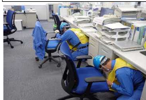
緊急地震速報受信後のJESCO増設事務所