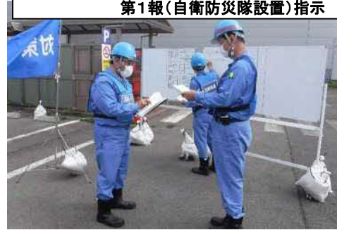
対策本部長：連絡・渉外班長へ対外連絡第1報(自衛防災隊設置)指示