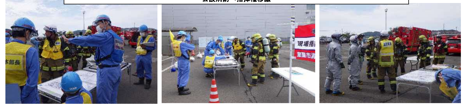
公設消防へ指揮権移譲