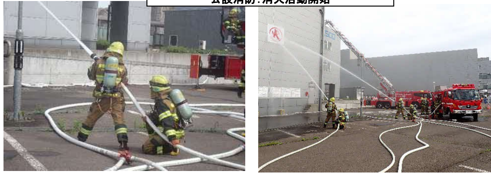
公設消防:消火活動開始