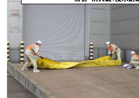
当初 消火班：浸水防止シート(ウォーターゲート)設置