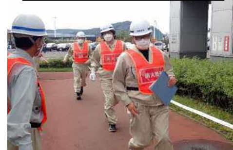
MEPS増設職員 避難状況