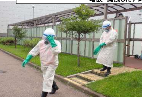
増設 漏洩したアンモニアの回収対応