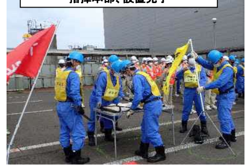
指揮本部、設置完了