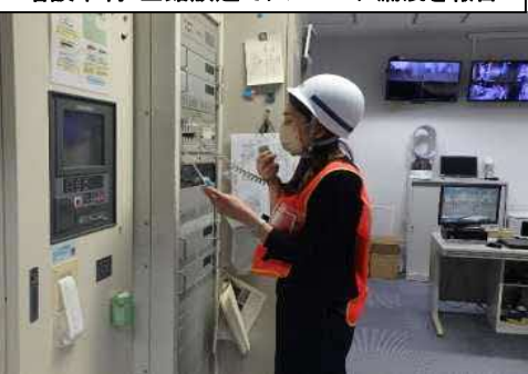
増設中制：全館放送でアンモニア漏洩を報告