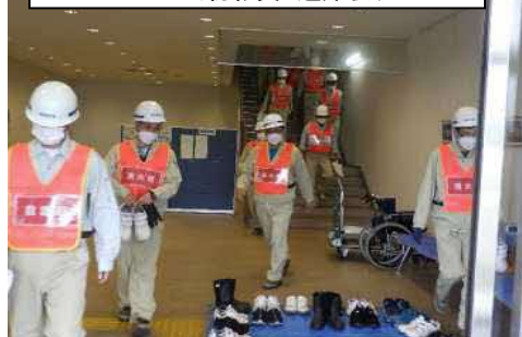
MEPS当初職員 避難状況