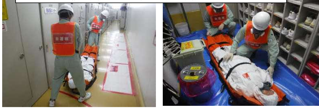
当初 救護班:負傷者を安全な場所まで搬送、負傷者を前室22で介抱