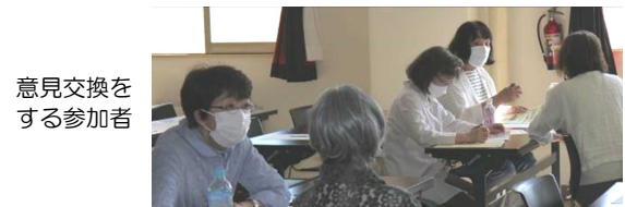
意見交換をする参加者