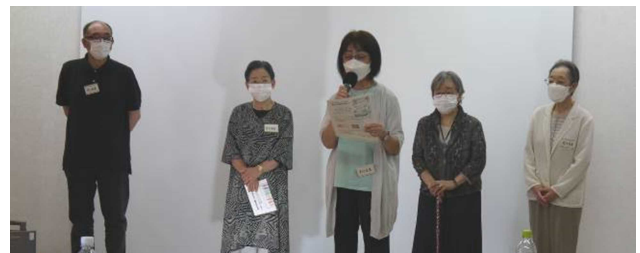
男女平等参画プラザ利用団体の紹介と実行委員長の挨拶

「結婚・家庭におけるジェンダー」をテーマにした巻では、近年では比較的多様なあり方が認められてきたとはいえ、性的役割に対する価値観が未だ根強く残っている中、若い世代の意見から考える内容でした。その中の20~30代の男女のトークセッションでは、「両親を見て将来的には結婚したいと思う」「今、自分がしたいこと優先。家族から（結婚を）勧められるプレッシャーを感じる」「事実婚、すごくいい」「独身について、自分の夢や仕事を優先、スタイルをつらぬくのはかっこいい」などの率直な意見が交わされ、結婚や家庭におけるジェンダーに関する様々な事柄について身近な事例をもとに考える機会となりました。