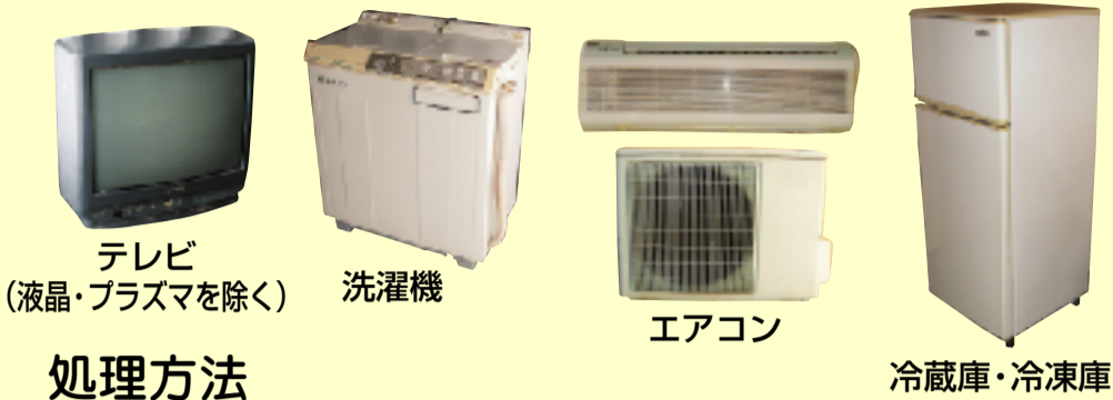
テレビ (液晶・プラズマを除く)