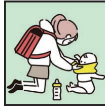
家族に代わり、幼いきょうだいの世話