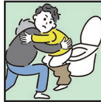
障がいや病気のある家族の入浴やトイレの介助