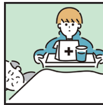
慢性的な病気の家族の看病