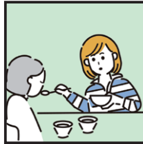
障がいや病気のある家族の身の回りの世話