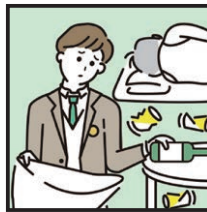
アルコールやギャンブル問題を抱える家族への対応