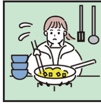
病気の家族に代わり、料理・掃除・洗濯などの家事