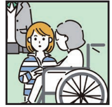
障がいや病気のあるきょうだいの世話や見守り