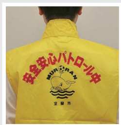
パトロールベスト