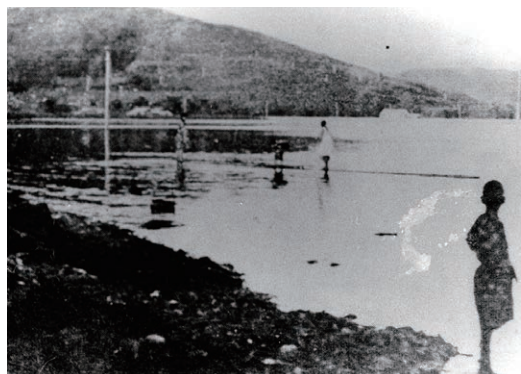
埋め立て前の本輪西海岸（大正初期）