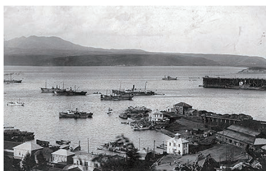
鉄道高架栈橋と港