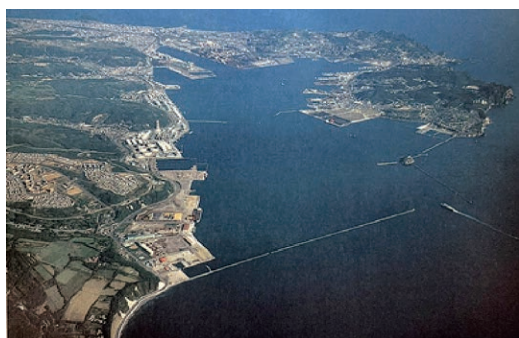
昭和60年代の室蘭港