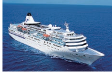
ばしふいっくびいなす

現在、祝津埠頭岸壁では、東北・北海道で唯一、世界最大22万トン級のクルーズ船が着岸できるように改良がすすめられています。今春から暫定的に大型クルーズ船による利用が可能となりました。第1船目として約6年ぶりの入港となる、“ばしふいっくびいなす”が着岸します。