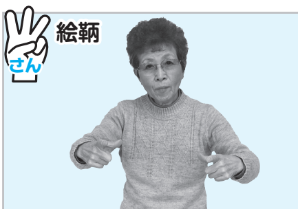
▲人差し指と親指で円を作る (旧絵鞆小学校の円形校舎をイメージ)