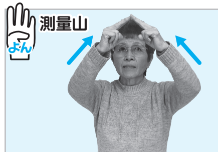
▲人差し指と中指で山の形を作る