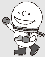
北海道新幹線開業PRキャラクター どこでもユキちゃん

平成28年3月26日、新青森駅〜新函館北斗駅間でいよいよ北海道新幹線が開業します。北海道新幹線は、東北新幹線の新青森駅から札幌駅に至る、全長約300キロメートルにおよぶ路線です。新函館北斗駅から札幌駅の区間は、平成43年3月末までの開通に向けて工事が進められています。開通後の、最も速い室蘭〜東京間の所要時間は、新函館北斗駅での乗換時間も含めて、これまでより1時間30分も早い約6時間30分