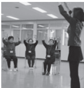
「えみなメイト」対象の65歳以上の高齢者に対する健康講座

主に支援が必要な高齢者に、緊急時の連絡先などの情報を記入し保管する、緊急情報記録票の配布を行うとともに、介護予防事業のえみなメイトは、高齢者が歩いて参加できるよう実施箇所を拡大します。