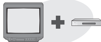
現在使っているアナログテレビに地デジチューナーを接続する