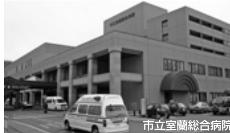
市立室蘭総合病院

病院事業・水道事業など本市の企業会計は、将来にわたり必要なサービスを安心・安定的に提供するため、厳しい環境の変化にも対応できるよう経営の総点検を行い、「中期経営計画」(平成17年度～21年度)を策定して計画性・透明性の高い企業経営を推進しています。