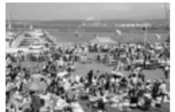
エンルムマリーナ祭