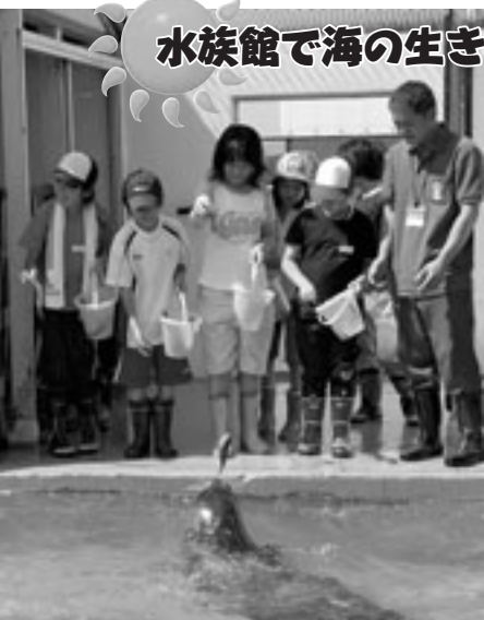
1日飼育係での、えさやり体験