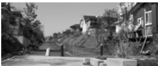
閑静な住宅街にある遊歩道は家族憩いの空間。

※第1種住居地域とは建ぺい率が60%、容積率が200%と 決められ、高層住宅がなく日当たりが良いなど、住環境に 配慮された地域のことです。