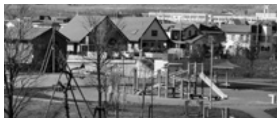
広くゆったりした八丁平北公園は、遊び場やくつろぎ の場として人気。