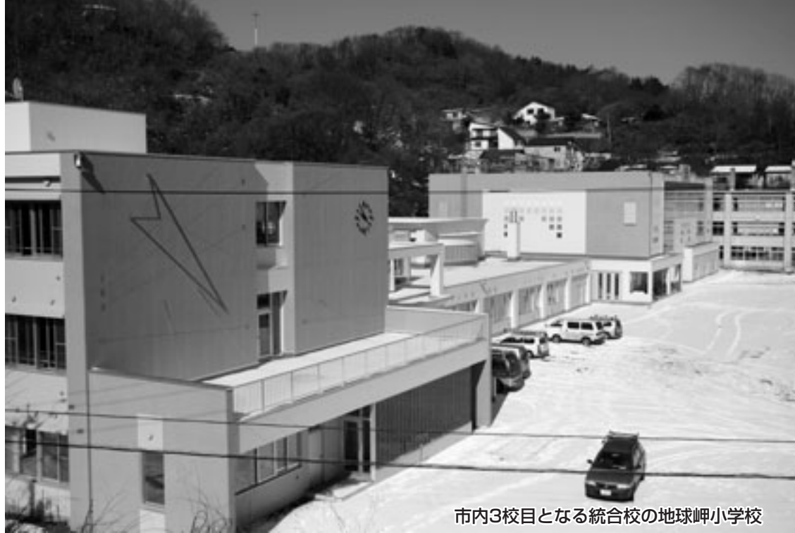
市内3校目となる統合校の地球岬小学校

朝陽小学校と母恋小学校が統合し、新たに地球岬小学校が市内3校目となる統合校として4月に開校。4月7日には新入学児童を迎えます。1日の多くを学校で過ごす児童にとって、学校は第2の家。児童が楽しく学べるよう、遊び感覚を取り入れた温かみある校舎となっています。