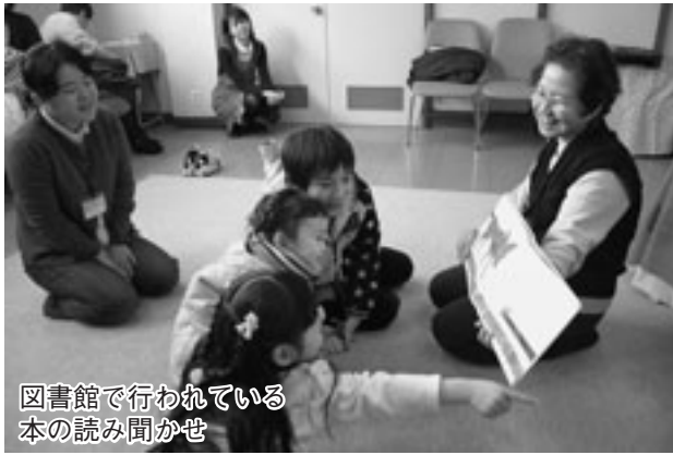
図書館で行われている本の読み聞かせ