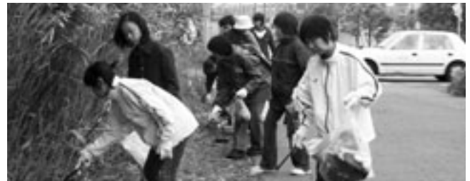
学校付近や公園などの清掃を行う高砂小PTAの皆さん

このほかにも、「私はこれができる」「こんなお手伝いをしたい」などみなさんの申し出を市民活動センターまで連絡してください。