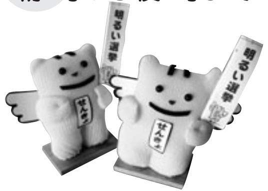
明るい選挙のイメージキャラクター「選挙のめいすい(明推)くん」