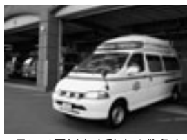
1日に10回以上出動する救急車

軽い病気やけがで救急車を利用 されると、緊急を要する症状の人 を病院に搬送するのが遅れて、命 が危険にさらされることになりか