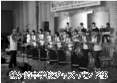
鶴ヶ崎中学校ジャズ・バンド部