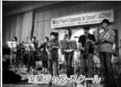
室蘭ジャズ・スクール