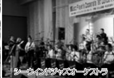
シーウインドジャズオーケストラ