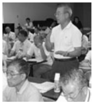
町会長からは、まちづくりから、身近な問題までさまざまな意見が出された。

町内会 少子化社会を迎え、今後、大学も学生定員枠の縮減や大学自体の統廃合もあるのでは。地域・大学・行政が相互に連携していく必要があり、大学にもこれまで以上に、地域と結びつぐための努力をしてほしい。 大学 大学は学生確保が最大の課題。地域連携の目的も、最終的には学生確保でもあり、地域活動を積極的に進め、学生の定員や大学が縮小されないよう、精一杯頑張りたい。なお、室蘭地区は住居費等が高く、経済的に苦しい学生が多い。学生に負担がかからない環境づくりに、皆さんの協力をお願いしたい。