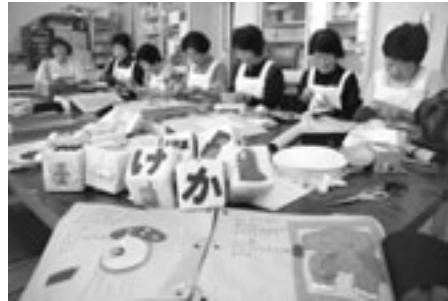
ことば遊びができるさいころなど、布で愛情たっぷりの作品を作っている。

室蘭ふきのとう文庫の皆さんは、20年以上にわたって、布の絵本やおもち作りに取り組んでいる。子どもへの思いがたっぷり詰まった作品は、児童福祉施設などにプレゼントし、大変喜ばれている。