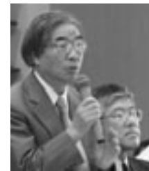
学長。学見を傾け、工業地域の耳をとつと答えた。

交流が深まり活性化した。先生方も、学生に「大いに行っていい」と激励していただき、学生が地域の行事に参加することも大きなことと思う。 ● 大学で行っている研究を市と協力して、市民対象のモニター調査などを行えば、町内会として手助けになれると思う。 ● ごみや資源物は、市で決めた収集日を守ってもらおうよう、大学から学生に、生活上のルールを指導してほしい。