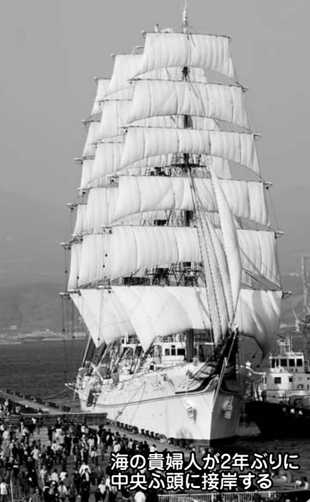
海の貴婦人が2年ぶりに中央ふ頭に接岸する