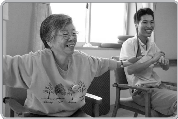
軽い運動やおしゃべりで健康づくり。介護予防で楽しい毎日を過ごしましょう。

介護を社会全体で支える介護保険。平成12年のスタートから6年が経ちました。今後は「団塊の世代」と言われる人たちが高齢者（65歳以上）の仲間入りをするなど、超高齢社会が到来します。