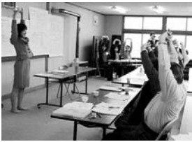
軽く体を動かすだけで介護予防の効果十分。気軽にお越しを。

健康講座で介護予防 6月から、市内14会場で1回2時間程度の健康講座を開催します。健康一口メモ、転ばないための運動(転倒予防)、思い出しの語り合いなどで、心と体のリハビリを行います。 日時や会場など、詳細は広報紙などでお知らせします。詳細はお問い合わせください。