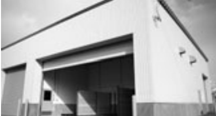
御崎町のプラスチック製容器包装ストック ヤード内に設けた古紙の搬入スペース