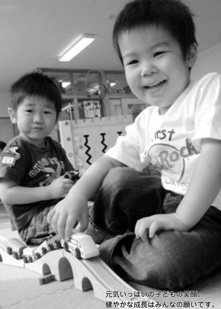
元気いっぱいの子どもの笑顔。 健やかな成長はみんなの願いです。