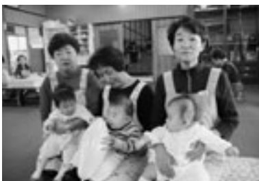
寿町子育てサロンのみなさん

「サロンの人たちが子どもを見てくれるので、お母さん同士でおしゃべりしても安心して子どもを遊ばせられます」「親子遊びができて、お母さんたちとお話しできる所が近くにあるので助かります」と、お母さんたちの人気も定着している。