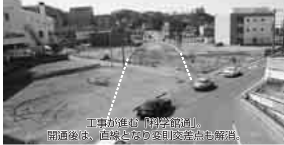
工が進む「科学館通」。開通後は、直線となり変則交差点も解消。