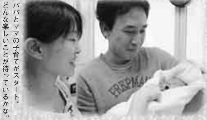
パパとママの子育てがスタート。どんな楽しいことが待っているかな。