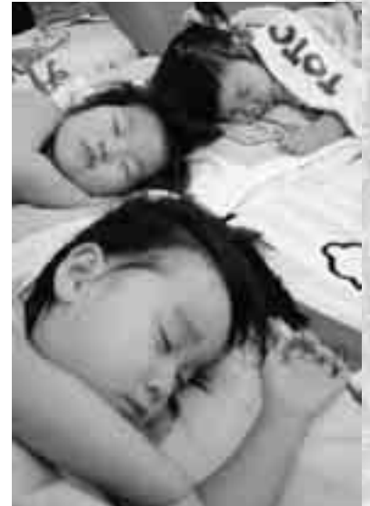
子供たちの夢をはぐくむ