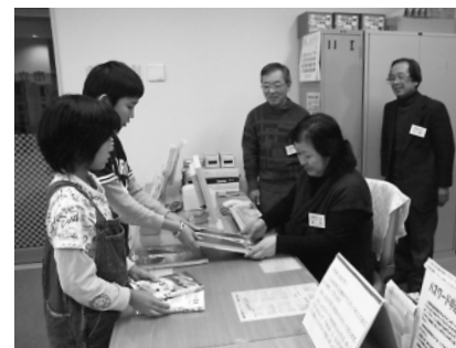
図書館輪西分室の時間延長(18時から20時)は、ボランティアで参加する皆さんによって実現した。

ボランティアで、市の事業に協力してくれる市民や市民団体です。無償ですが、活動に必要な用具などは市で用意します。 現在、成人祭の実行委員、市民見学会のガイド、図書館、港の文学館、民俗資料館などで自発的に活動し、市民サービスを提供しています。