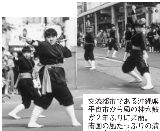
交流都市である沖縄県平良市から風の神太鼓が2年ぶりに来蘭。南国の風たっぷりの演舞が市民を魅了した。

夏の本領発揮。 気温25度を超える夏日が連続し 「夏将軍」のような 厳しく暑い夏となった室蘭。 港まつりやイタンキ浜海水浴場では、 ギラギラと照りつける太陽のもとで 多くの市民が夏を思いっきり楽しんだ。 気温とともに市民の熱気を盛り上げた 夏の主役たち。 「夏得」した夏模様を紹介しましょう。