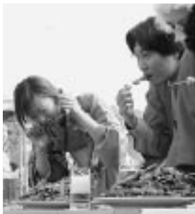
早食いも飛び出し、笑いを誘ったやきとり祭り