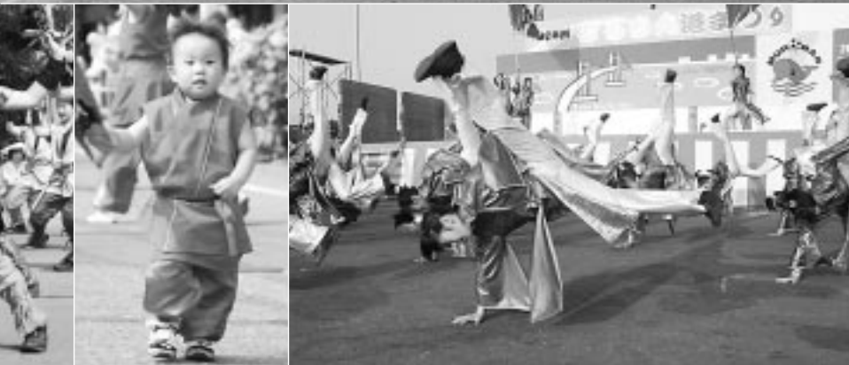
14団体が躍動したよさこいソーランinむろらん