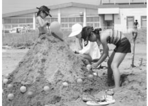
砂の芸術家たちが取り組んだ砂の造型コンテスト (8/1 イタンキサマーフェスティバル)