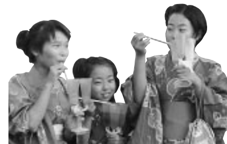
露店めぐりは浴衣で決まり。手作りの味、おいしいね。