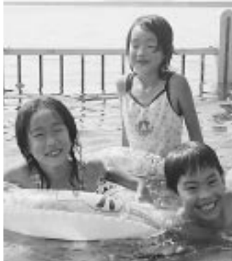
水遊び最高。絵鞆臨海公園でも子どもたちの元気な声がこだました。