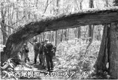
西尾根コースの巨大アーチ