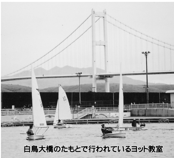
白鳥大橋のたもとで行われているヨット教室