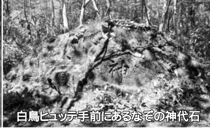
白鳥ヒュッテ手前におるなぞの神代石

市街地に近く、1時間程度で登れる山は道内で数少ないこともあり、登山者は全道各地から訪れる。自然財産の魅力は、室蘭岳の頂きに達した瞬間に心から味わうことができる。山頂を目指すには、白鳥ヒュッテを起点とした夏道・西尾根コースが一般的。そのほかにも沢登りルートもあるが、初心者は危険なので、経験者の同伴が必要だ。ヒュッテで、登山者名簿に名前と住所、入山時刻を記入してスタート。自分のペースで無理せず登ろう。 夏道コースは22km。10分ほどでガンバ岩に達する。急こう配だが、ベ