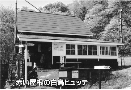
赤い屋根の白鳥ヒュッテ