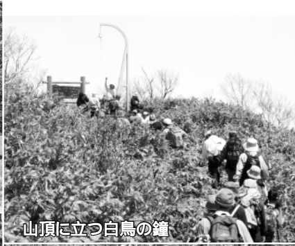
山頂に立つ白鳥の鐘