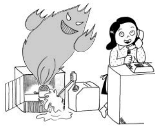
油断大敵、火の恐怖

平成15年中に市内で発生した火災は、建物27件、車両3件、その他4件の合計34件で、前年に比べ件数および損害額ともに若干減少しました。これからも一人ひとりの注意で、恐ろしい火災を防ぎましょう。