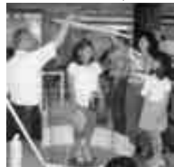
青少年科学館の利用目的は？