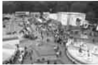
水族館の利用目的は？

60%、夏休みが25%と休日の利用者が多い。 利用目的は魚を見るが31%、遊具を楽しむが18%、トドやアザラシを見るが16%で、施設の充実を望む声では、魚の種類を増やす、遊具の充実の希望が多い。