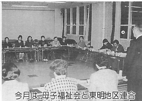
今月は、母子福祉会と東明地区連合