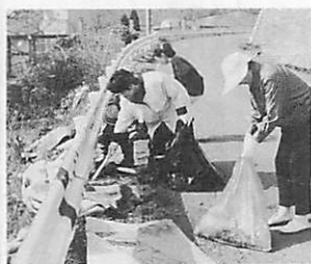
みんなの協力がないマチに

市といたしましては、基本的にゴミ清掃は行政主導ではなく地域の方々に自発的に取り組んでいただくことを目指しており、実際に相当数の地域で定期的に実施されていますことから、美化推進員の協力も得ながら地域でお願いしたいと思います。