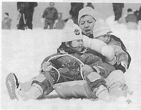
手作りソリじゃないけれど 親子仲良くソリ滑り