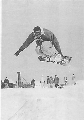
空中を滑走？のスノーボードワンメイクジャンプ

「冬はやっぱり雪遊び」と、雪が豊富なだんパラスキー場周辺を会場に行われた“だんパラスノーフェスティバル”。メインの手作りソリ大会やスノーボード大会に市民らの元気な歓声が響いた