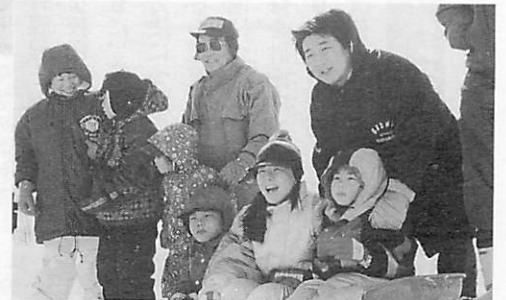
次々と滑走するユニークな手作りソリに 応援の声が