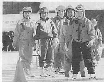
子どもたちが 健康やかに成長できる環境を

そのため、各学校には、子供一人ひとりの良さや可能性を生かした教科指導、生命や人権の尊厳を大切にされた道徳教育や生徒指導を適切に実践できる教職員の資質向上に努めることを求めています。 ・家庭教育の重要性を認識するとともに、子育て支援につながる開かれた学校づくりに取り組み、家庭を含めた教育機能の活性化に努めていきます。