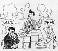
4月から環境クリーンな職場になります

4月から、市役所の本庁舎をはじめ、各施設の職場内では、禁煙となります。喫煙する場合は、指定された喫煙コーナーを利用していたり、ご協力をお願いいたします。