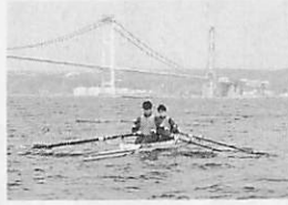
潮風を切って水面を走ろう

①社会人ボート教室 対象 18歳以上の社会人 期間 4月29日から10月までの好天時 時間 平日：17時30分～日没、日・祝日：10時～12時