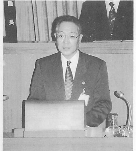
市政方針を述べる新宮市長

平成9年第1回市議会定例会が、2月26日から3月25日まで開かれました。新宮市長は初日の本会議で、本年を「未来にはばたくサークル都市実現のため、市民と共に行動し実行する年」とし、また、門馬教育長は教育行政方針説明の中で「人を大切にすることを育てる」と所信を述べました。