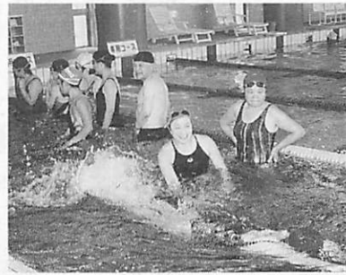
いつまでも勉強やスポーツのできる環境を