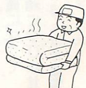
気持ちのいいふとんをお届けします

クリーニング業者が定期的に自宅に伺い、無料でふとんを回収し、丸洗い、乾燥させ届けるサービスです。