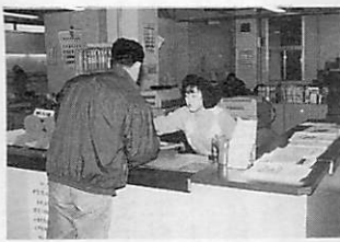
仕事帰りでも間に合います

※住居表示に関する事務(建物新築届出及び証明等)については延長時間では取り扱っていませんので、ご了承ください。