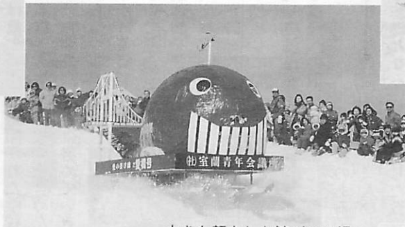
大きな顔をした鯨がソリ滑り