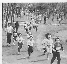
春風の中を駆け抜けよう

対象 市民および市内に通勤・通学している人 参加料 中学生以下100円、高校生以上300円 申込方法 当日会場 ※小雨程度は決行。全員に