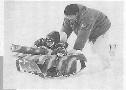
途中で滑らなくなったソリに係員がお手伝い