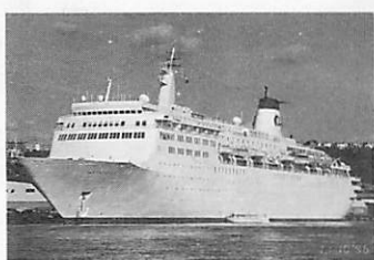
白い船体はまさに船上のホテル