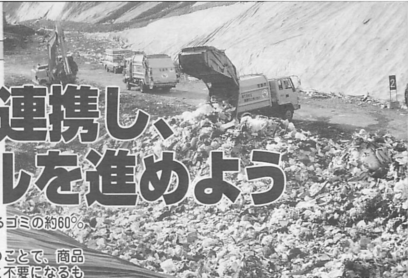
神代最終処分場には大量の「容器包装」が...

大量生産・大量消費の現代、家庭から出るゴミの約60%（容積比）は容器や包装ゴミです。