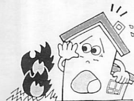
火の取り扱いに注意を

○ゴミ焼きなどでは、強風時や乾燥注意報が出ているときはしない ○消防署に連絡し、消火の準備をしてから行う ○場所を離れるときは、火を完全に消す ○たばこの投げ捨ては絶対にしてはいけない