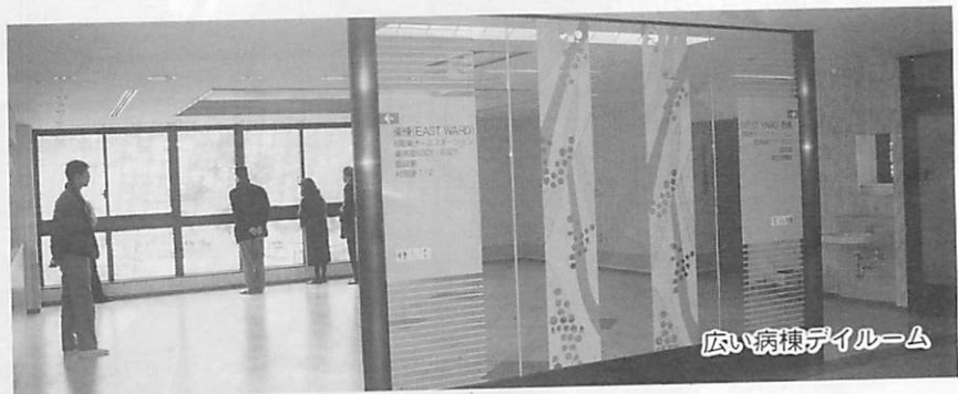
広い病棟ダイルーム

6月から市立病院は 住所 山手町3丁目8番1号 電話番号 ㊟3111 FAX番号 ㊟6867 になります