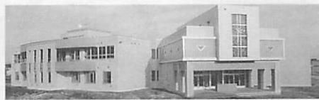
4月開校予定の八丁平小学校

現在、市では八丁平地区の宅地分譲を行っています。地区内では、4月から幼稚園や小学校の開校が決定し、いよいよ活気づいてきます。