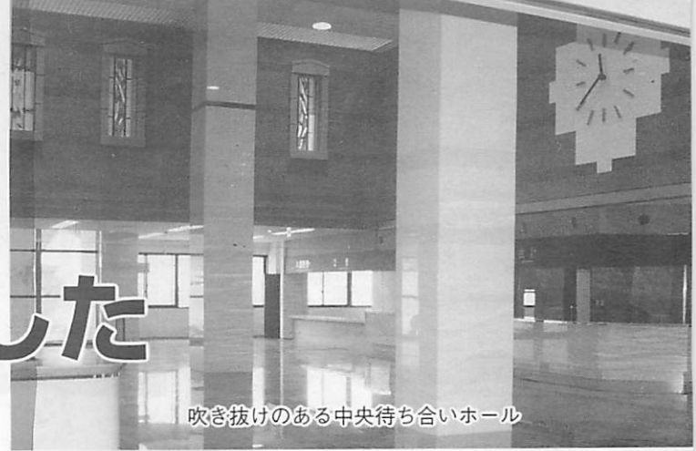
吹き抜けのある中央待ち合いホール