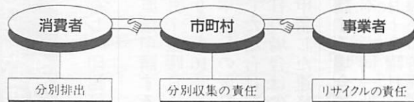
役割がはっきりした「容器包装リサイクル法」

「容器包装」とは、商品の容器や包装のことで、商品が消費されたり、商品と分離されたときに不要になるものです。今年4月に施行される『容器包装リサイクル法』は、指定された容器や包装を消費者は分別排出、自治体は分別回収、事業者は再商品化することが義務づけられています。これを受けて本市でも10月から分別回収を始めますが、ここでは『容器包装リサイクル法』の内容と本市の取り組みについて紹介します。