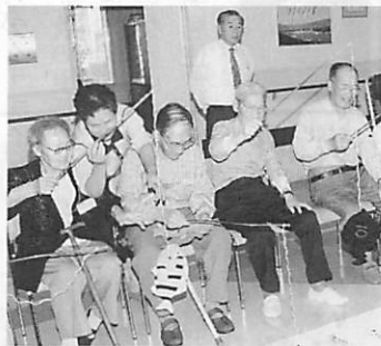
お年寄りや障害者に優しい町づくり

お年寄りや障害者に優しく、住む人のぬくもりが伝わってくる町づくりが大切であり、そのためには、在宅福祉の充実に加え、保健・医療との連携が求められていると考えます。