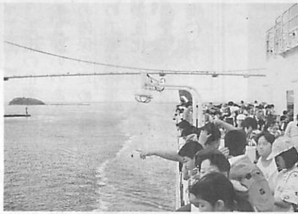
小学校4年生を対象にした港・ふるさと体験学習

○「住む町に学ぶ」では、小学校4年生を対象に、社会科学習の一環として、フェリーを活用した、港の町室蘭再認識の