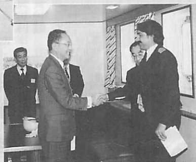
入港歓迎セレモニー