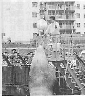
4月からお年寄りや子どもは無料となる水族館

・事務事業の改善として、市立病院の医療事務業務や公害部門の分析業務の委託化の推進など、事業推進方法の見直しを進めるとともに、水道・下水道料金との改定に伴う、公衆浴場や障害者世帯への減免の拡大、また、水族館、青少年科学館、民俗資料館でのお年寄りや子ども料金の無料化などを進めます。