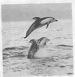
今年も豪快なジャンプが見られるかな?

林の中に、伝説を基にした20のポイントがあります。 期間 4月28日～10月10日 時間 9時30分～16時30分 料金 小・中学生150円、大人300円 ※4月28日は無料開放 《詳細》観光協会 ☎230102