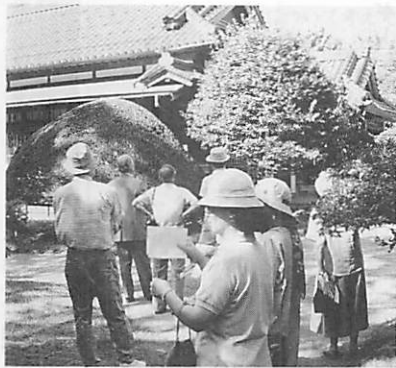
町の歴史を知り、新たな発想を（写真は昨年のふるさと歴史見学会）