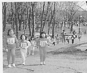
さわやかな風を受けて走ろう

種目 ○1km：小学4年生以下 ○2km：小学5・6年生、中学女子 ○3km：中学男子、高校女子、一般女子 ○5km：高校男子、一般男子 《詳細》文化振興課文化振興係 ☎25094