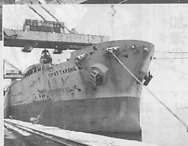
3万隻目の入港となった イスパット・タラン号

港は、地域の産業や生活を支える基盤として、市民の貴重な財産です。今後さらに港の発展を目指し、市民に親しまれる港づくりをしていきます。