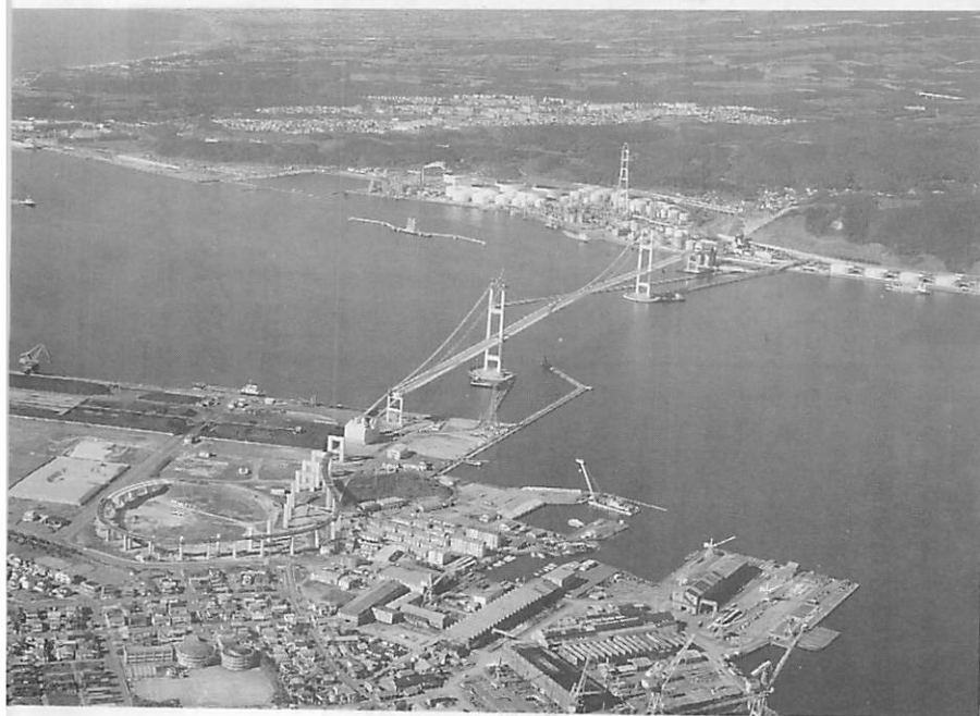
町の出発点となった室蘭港を産業と生活の母港に

本市の企業活動の活性化による、働きがいのある安定した雇用の場の確保のため、道内における有数の工業技術集積の、さらに多角化、高度化へ向けた取り組みを、地域企業や室蘭工業大学などの連携により、一層進めなければなら ないと考えます。 特に、新エネルギーや環境関連産業は、これまでの鉄鋼を中心とした地元企業に蓄積された、素材やエンジニアリングの技術を生かした今後の新しい産業展開の方向性とを考え、それに向けての取り組みを進めます。