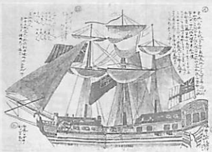
200年前、室蘭港にやって来たプロビデンス号

1796年9月28日、プロートン船長率いるイギリスの探検船プロビデンス号が室蘭（エトモ）にやってきました。未知の北太平洋海域調査が目的で、津軽海峡と間宮海峡を実測し、サハリン（樺太）と北海道が島か半島かを調べようとしたものです。船は全長約33m、総トン数が約400トンの木造帆走軍艦。当時としては決して大きい船ではありませんでした。滞在中に、水夫のハンス・オルソンが作業をしている事故死。プロートン船長は、彼を大黒島に葬り「オルソン島」と名付けました。その霊を慰めるかのように、そのころから大黒島には黒ユリが咲き出したと言われていますが、残念ながら今は絶滅寸前です。島内には現在、オルソンの慰霊碑が建っています。