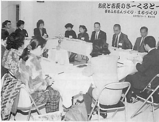
市民と市長のさーくるとー 夢あふれる人づくり・まちづくり