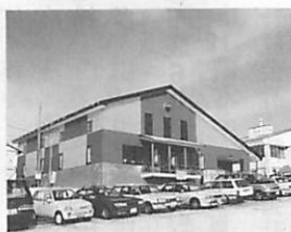
皆さん、ぜひご利用ください

選挙管理委員事務局 ☎222800 ※しほらくは、一部未設置の課もあります ※市役所代表電話番号(☎221111)はこれまでと変わりません 《詳細》総務課 ☎22215