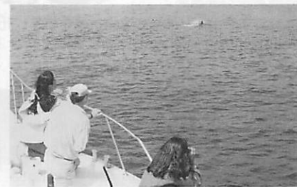
人気が高まるイルカ・鯨ウオッチング

③：平成2年から鯨コーナーを設置し、ビデオ放映を実施していますが、今後とも最新の情報を盛り込むなど親しまれるものにしていきたいと思います。