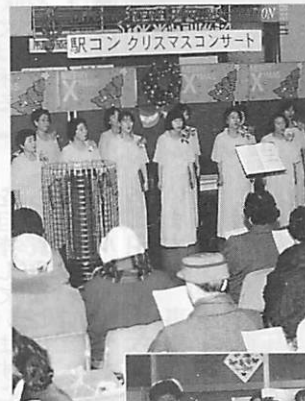
▶市立室蘭総合病院 院内コンサート(12/18)