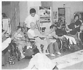
一層の充実が望まれる福祉政策

ポータルレーニングセンターは、それぞれ景観的にも魅力があると思います。市民の皆さんもぜひ利用していただきたいと思っています。 ②：中央町と地球岬間は一部整備済みで地球岬とみゆき町間は未整備、みゆき町から先は整備済みになっています。 道路管理者の北海道は、国道36号を内環状、観光道路を外環状として位置付けていますことから、市としても今後とも早期整備に向けて北海道に対し、要望していきたいと思います。 ③：バスの無料券は、年齢を基準として、以前に実施していましたが、使用の適正さに問題がありましたことから廃止し、別の福祉政策に切り替えた経過があります。 国のゴールドプランに基づき福祉計画を策定していますので、要望のありました件については今後の参考とさせていただきます。