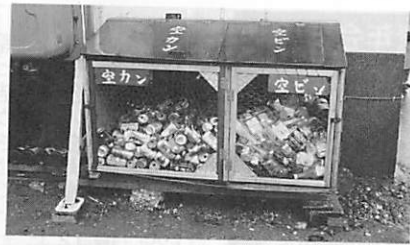
一人ひとりのモラルで ゴミのないまちに!