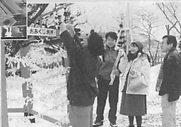
◀高校合格祈願を絵馬に託す中学生

病院や駅でコンサート 市立病院や室蘭駅で恒例のコン サートが開催され、訪れた市民ら はクリスマスの調べを楽しんだ