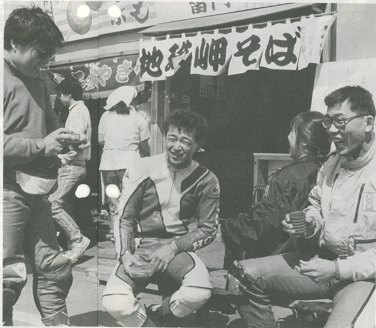
楽しい思い出は笑顔で広がる

昭和60年に行われた「北海道の自然100選」で、地球岬が得票第1位になったのを契機に、新たな観光都市としてのスタートを切った室蘭。以来、観光客が増え始め、施設の整備も進んでいます。また今年度は、国体サッカー競技が行われ、全国からたくさんの方がマチを訪れることになり、室蘭のPRには絶好のチャンス。観光のまちへの第一歩は、訪れる人々を温かく迎えることです。新しい歩みのためには、みなさんの力が必要です。