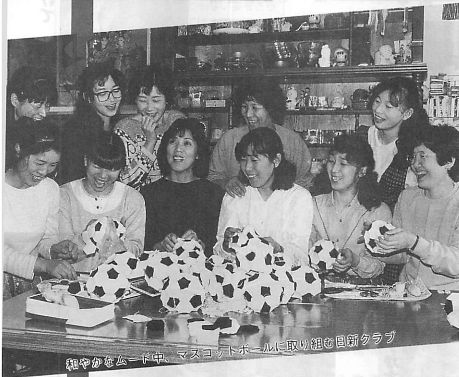
和やかなムード中、マスケットボールに取り組む日新クラブ

国体サッカー競技に出場する各チームに、何か記念に残るものをプレゼントしようと、ママさんバレーボールチーム、日新クラブが、マスケットのサッカーボールを作り始めた。