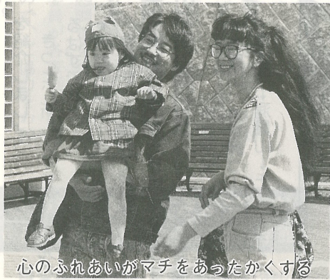
心のふれあいがマチをあったかくする

観光地の整備がいくら進んでも、ゴミや空き缶などが散乱しているようでは、せっかくの景観も台無しに