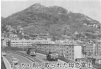
すっかり削り取られた母恋富士

多く、高さも規模もほぼ同じです。いずれも分厚い火山岩を突き抜けていますから、噴火のエネルギーがかなり使われたはずで、火山灰は今以上に厚く半島を覆っていたと見てよいでしょう。