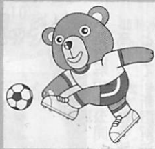
ママさんバレーボールチーム 日新クラブの巻

あと100日余りに迫った国体。私たち市民一人ひとりが協力し合い、訪れる人たちを温かく迎え、ぜひとも成功させたいものです。