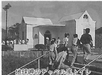
地球岬のチャペル風トイレ

▷内 容 ○基調講演 13時30分 ①トイレによる観光の国際化 ②女性の立場に立ったトイレづくり ○パネルディスカッション 15時30分 ①さわやかトイレ運動の実践報告ほか ▷参加料 無料 ▷参加方法 当日参加自由 〔詳細〕 建築課 ☎内線2673