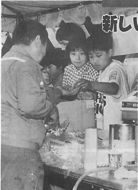
市民の出店で盛り上がった昨年の港まつり