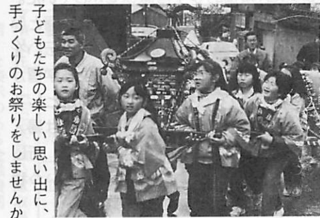
子どもたちの楽しい思い出に、手づくりのお祭りをしませんか