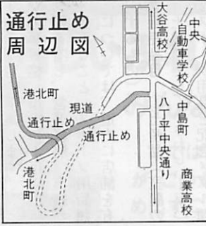
《詳細》都市計画課街路係 ☎内線2596