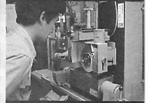
産業からの マチづくり