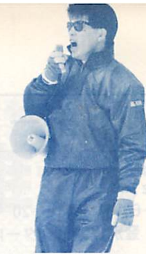
▲スタートするぞー