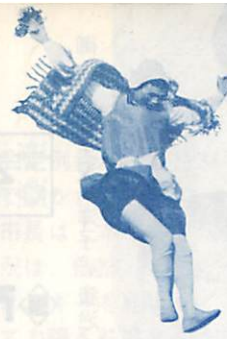
◀ジャンプ一番 これぞおいらの パフォーマンス