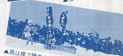
▲男は裸で勝負します