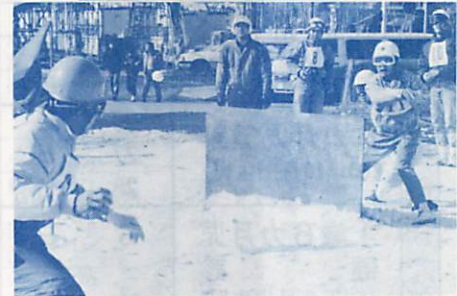
▲エキサイティングな 雪合戦も頭で勝負さ