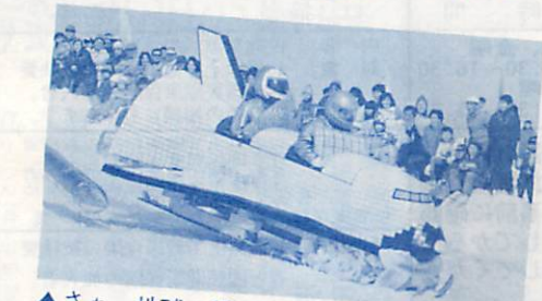
▲さあ、地球へ帰還するぞ