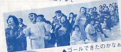
▲ゴールできたのかなあ