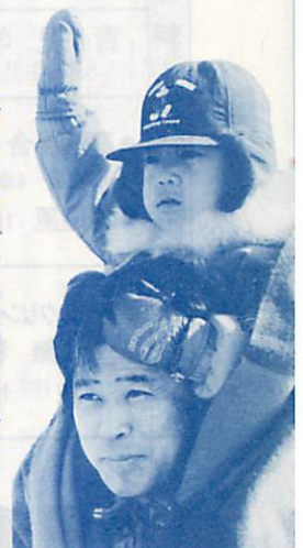
▶ぼくもライプマンになりたいよ