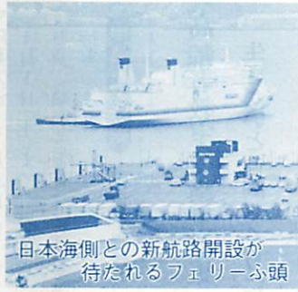
日本海側との新航路開設が待たれるフェリーふ頭