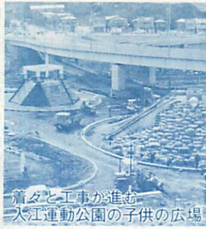
進捗工事と公園の子供の広場

また、公園では、入江運動公園の子供の広場を始め、既設公園の整備を進めてまいります。