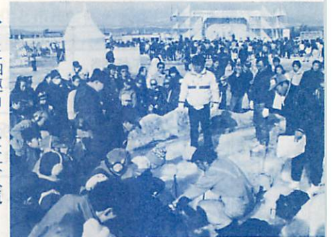
▶ミニ四駆コースは大人気