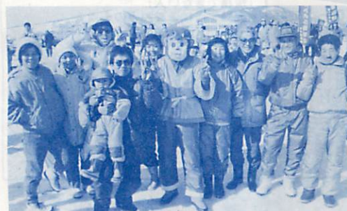
▲やったネ、賞金の10万円で来年も頑張るぞ