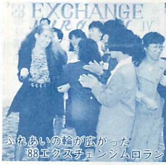
国際交流推進協議会

国際交流については、工業大学での留学生の受け入れ、高校生の相互交流などが行われており、室蘭市国際交流推進協議会