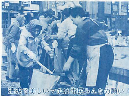
清潔で美しいマチは市民みんなの願い

の通年利用を目指した造成を進めてまいります。また、日本海国際ヨットレース、ボードセイリング噴火湾横断レースなども支援してまいります。