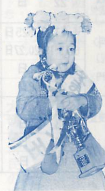
▲わたし、プリンセスになりました