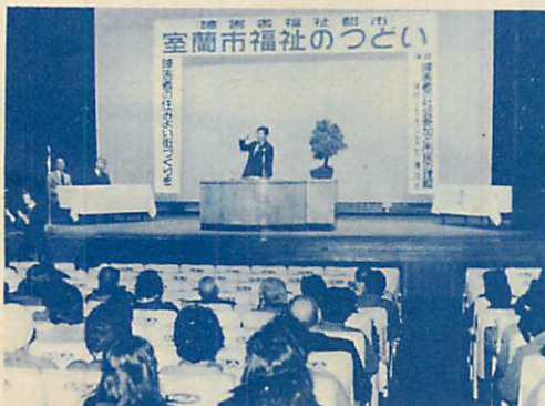
多くの人々が参加した「室蘭市福祉のつどい」

とができました。身体の不自由な方々の社会参加を進めるためには、まず、生活環境の整備改善が第一に必要であると考えます。しかし、これにもまして重要なことは、身体の不自由な人の立場になって考える心、つまり「福祉の心」が市民全体に根づくことが大切なことだと思っております。障害者の福祉は、一朝一夕に進むものではありませんが、今後におきましても、「障害者に関する長期行動計画」を基に引き続き、この事業を積極的に推進してまいります。今後とも、市民皆様をはじめ関係機関のご協力をお願い申し上げます。