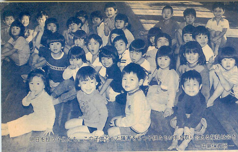
明日を担う子供たち。この子供たちと障害をもつ子供たちが手を取り合える福祉社会を 中島保育所