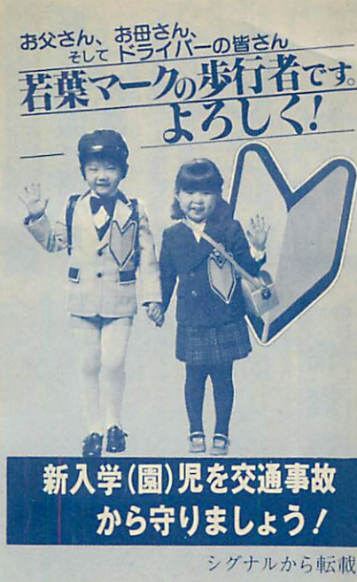
シグナルから転載