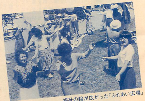
福祉の輪が広がった「ふれあい広場」

○障害者に対し、理解を深めてもらうための啓発用福祉フィルム(16ミリ)を購入し、社会教育課に備え付け(9405)