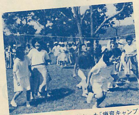
楽しかった「療育キャンプ」