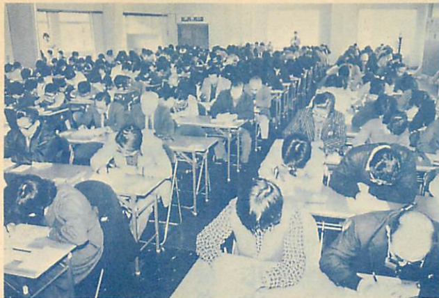
▲28日、開港110年市制施行60年協賛行事の「市民漢字大会」が室蘭民報社の主催により行われ、小学生から72歳のお年寄りまで271人が参加し、難問に取り組んでいました。