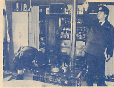
火気の点検は細心の注意で

年末・年始を迎え、何かとあわただしい季節となりました。例年この時期は、忙しさにまぎれて火の取り扱いに対する注意が