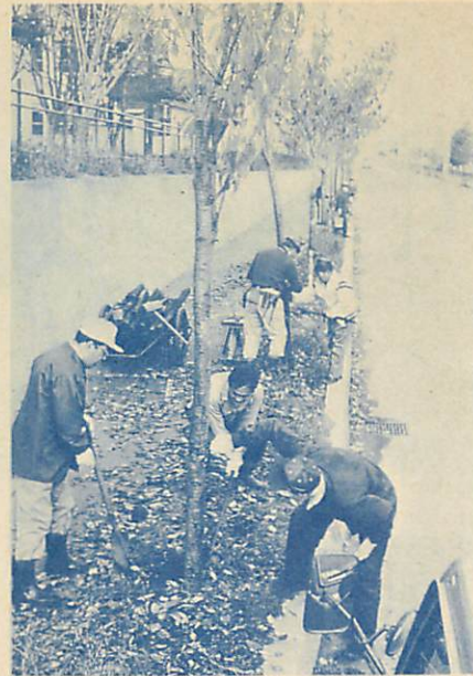
▲冬將軍の到来を前に、19日、水元町会（関口嘉吉会長、100世帯）では、自慢の桜並木の手入れを。会員26人が約250本の桜の消毒、支柱の取り替えなど熱心に作業を進めました。