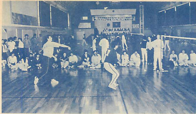
▲日頃、学校開放を利用してスポーツで汗を流しているバドミントン愛好者が交流を深めようと、14日水元小体育館で、水元小学校開放自主運営委員会主催による「第1回学校開放校対抗バドミントン大会」が行われ、各コートで熱戦が繰り広げられました。また、同会場で「第1回室蘭地区ジュニアカップ争奪大会」も行われました。