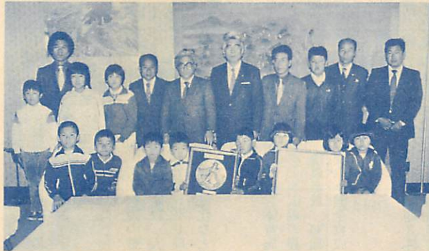
▲市長を囲んで記念撮影する喜門岱小児童ら