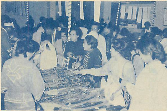
◀27、28、姉妹都市・清水市で「室蘭の観光と物産展」（3年ぶり2回目）を開催。コンブやジャガイモなど北の味覚に人気が集まり、約2万人の入場者があり、大盛況の2日間でした。

お正月は日本髪に和服でーというのが昔から女性の「ハレの日」の装いの常識でしたが、最近は何となく少なくなりました。 年の瀬ともなると髪結（かみゆい）さんは目の回るような大忙しですが、順番待ちで除夜の鐘を聞きながら日本髪を結いあげた思い出をもつ女性も多いはず。寝ないでも髪を結うというのが女の心意気でした。 その艶めかしい黒髪の美しさとともに、特に明治、大正の娘たちの胸をときめかせたのが櫛（くし）、簪（かんざし）、簪（こうがい）など華麗な髪飾り類でした。写真は右から鏡（けすじ）櫛（髪分けと髪押し用）、鬘（びん）櫛、梳（すき）櫛で、黄楊（つげ）や竹製。平安時代の女性は長い垂髪でしたから梳櫛が中心だったようです。 また左上3点は