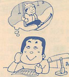
休みは計画をたてて

冬休みは、子供が学校から離れて1年間を反省し、新しい年への抱負をもち、自らの生活設計を見直すとともに、年末・年始の家庭的な行事や地域の活動に参加するなど、子供にとって、主体的な生活体験をするよい機会です。でも、この時期は年末・年始のあわただしさや解放的な雰囲気などの影響を受け、思わぬ事故を起こしがちでもあります。家庭では、子供の冬休みの生活について、学校の指導方針や指導内容を十分理解し、学校との連携を密にして、事故防止に努めましょう。