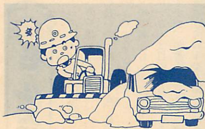
除雪作業の大敵、違法駐車

◎違法となる路上駐車はやめましょう。道路を自動車の保管場所としての使用は罰せられます。特に夜通しの駐車は、夜間や早朝の除雪作業に支障となるばかりでなく、緊急活動にも支障をきたし事故につながります。