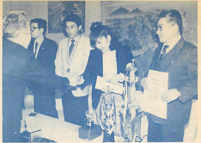
3月23日 — 身障者スポーツ大会で室蘭勢、大健闘 —

防火設備、管理体制の整っている市内のホテル、旅館6社に、市消防本部から「適マーク」を交付しました。