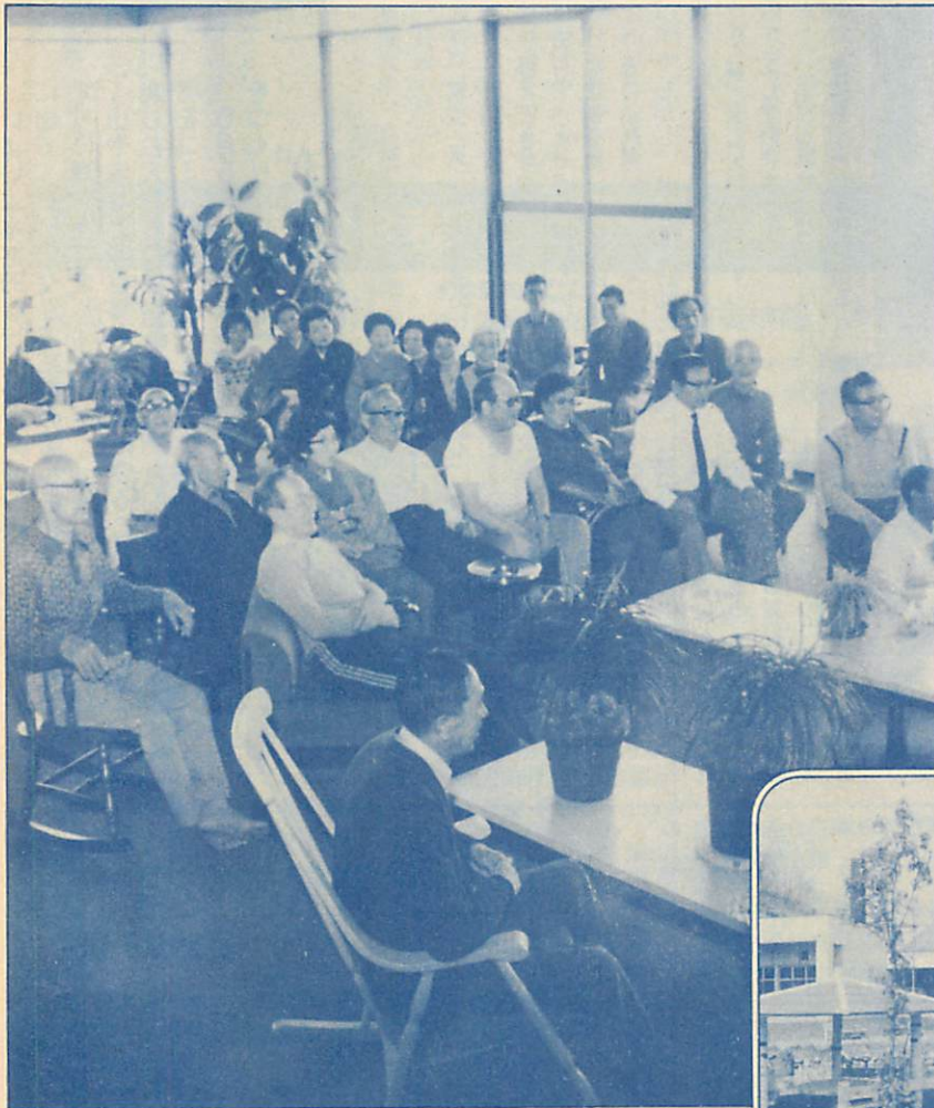
▲ロビーでくつろぐセンター利用者 ▶中庭から