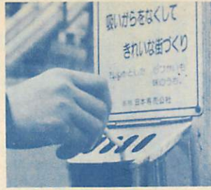
吸いがらは灰皿へ……これも公衆道徳