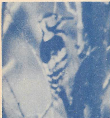
測量山で

いすすと、樹も年数を経てきますと、病気がかかったり、風で折れたりして、衰弱した樹がでてきます。このよわった樹を選んで、樹の材質をたべる、こん虫が集ってきます。このこん虫がキツツキの大切な食糧になっているのです。