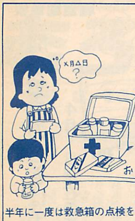
半年に一度は救急箱の点検を

家庭常備薬と常備器具を備えておくことと便利ですが、あくまで応急処置的なものです。 ・内服剤 消化薬、下痢止め、頭痛などの痛み止め、かぜ薬など ・外用剤 外用消毒薬、外用軟膏、バンソウ膏類、小児用浣腸薬など ・その他 体温計、ほうたい、ガーゼ、ハサミ、水枕、ピンセットなど 薬を過信せず、正しく用い、薬に頼りきらない習慣が大切です。 (室蘭薬剤師会)