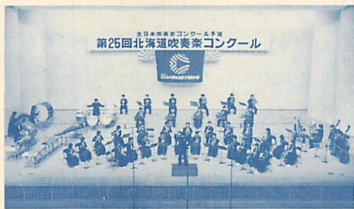
全国レベルの吹奏楽部は私達の誇り

従って、この例の場合、建設費の総額1億4、540万円のうち、1、579万円が超過負担となるわけです。