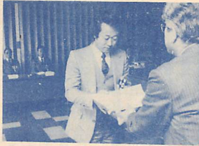
昨年の表彰式から

従業員表彰 本市に居住し、かつ本市内の事業所などに20年以上勤務する従業員で、勤務成績が優秀で他の者の模範となる人 経営者表彰 本市で10年以上の営業実績があり、常に経営管理技術の改善向上などに努めると