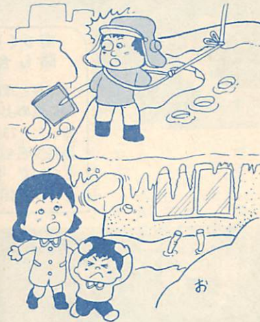
雪降しは歩行者に危険のないように

例年、冬になると屋根に積った雪、氷、つららなどが落ちて歩行者がケガをしたり、不幸にして死亡するという事故が起きています。また、建物の管理者も落雪事故で損害賠償の責任を問われたという例もあります。 雪の始末については、皆さんもご苦労されていると思いますが、落氷雪事故の防止と、冬の交通を円滑にするために、次のことにご