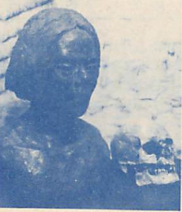
昭和38年給納遺跡出土の人骨(約2,000年前)から復原した原始人