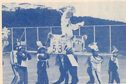
白小子どもフェスティバルから

ぼくたちの学校は、開校五年目にして生徒数が一千二百人位になったマンモス校です。 学校のまわりにはたくさんの花だんがあり、春はチューリップや水せん、夏にはあやめ、秋にはサルビア、松葉ぼたんなど、たくさんのお花が咲きます。また、学校中を花いっぱいしようとして一人一鉢運動をしています。